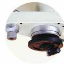
27 上下微調 (10/12/16系列)