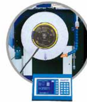
16 砂輪振動平衡校正儀