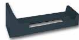
14 618 / 818 防水罩