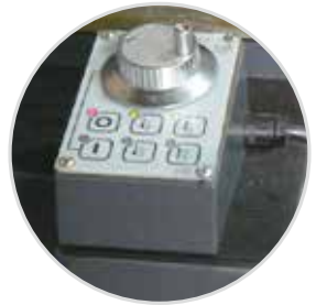
19 昇降快慢速微調式電子式手輪