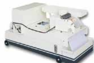
8 自動紙帶水機附磁性過濾器