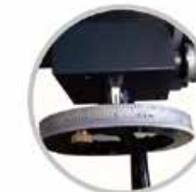
25 前後微調 (618/818 系列)