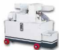
5 單用水機附磁性過濾器