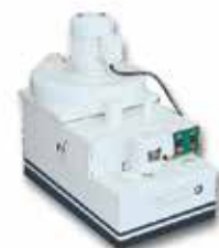
7 吸塵冷卻兩用水機