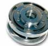
20 砂輪殼 (有刻度 / 無刻度)